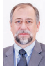
○ مارتن كورباني.

في إنجاز يضاف إلى سلسلة الإنجازات بمستشفى الملك حمد الجامعي نجح فريق طبي جراحي من قسم الأطفال بالمستشفى بإشراف البروفيسور مارتن كورباني استثنائي جراحة الأطفال في إنقاذ رضية بحرينية تبلغ من العمر سبعة أشهر تعاني من ورم سرطاني في الكلية اليمنى.